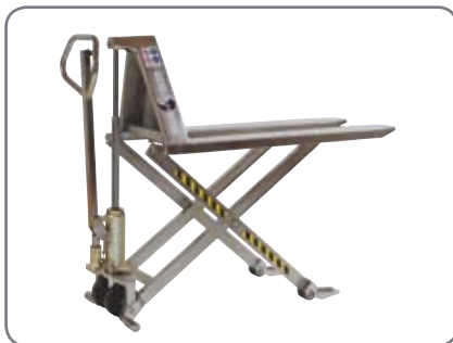
Standardprodukterna är manuella och tillverkade i rostfritt stål.