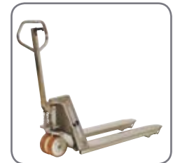
En kraftig konstruktion ger lång livslängd och låga underhållskostnader.