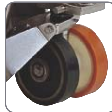
Produkterna har minst ett testat antistatiskt hjul som avleder den statiska elektriciteten.