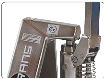
De explosionsskyddade produkterna är tilltänkta läkemedelsindustrin, färgindustrin samt olja- och gasindustrin.

Fråga efter materialspecifikationer eller besök www.logitrans.com Vi erbjuder också kundpassade lösningar.