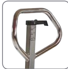
Ergonomiskt handtag ger användaren ett avslappnat grepp.

Produkterna är placerade i materialgrupp II och är godkända för områden som är klassade som zon 1/zon 21 (täcker också zon 2/zon 22). Det vill säga de områden där man kan räkna med att det tillfälligtvis uppstår farlig explosiv atmosfär på grund av olika gaser eller damm.