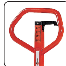
Det ergonomiska handtaget ger användaren ett avslappnat grepp. Möjlighet att märka staplaren med namn/avdelning.