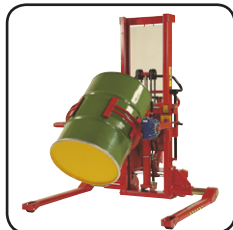
Fås med bl.a. sidotiltgafflar och/ eller extrautrustning som fatvändare, kranarm, pikbom och fjärrmanöverdon.