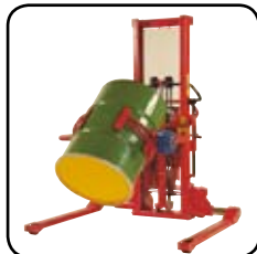
Fås med bl.a. sidotiltgafflar och/eller extrautrustning som fatvändare, kranarm, pikbom och fjärmanöverdon.