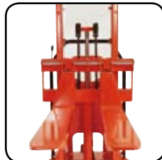
Justerbara gafflar finns i många olika längder och typer.