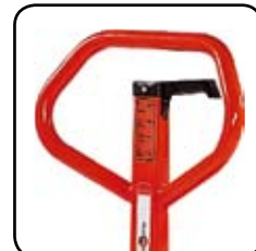
Det ergonomiska handtaget ger användaren ett avslappnat grepp. Möjlighet att märka staplaren med namn/avdelning.