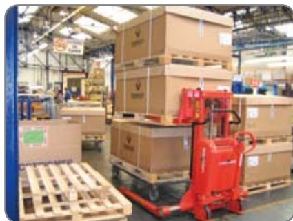
En kraftig konstruktion ger en lång livslängd och låga underhållskostnader.

***** Tester visar att 1700 mm räcker - beroende på stödbensavståndet.