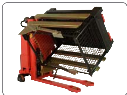
Behållaren kan roteras 180° och tömmas helt. Här måste Rotatorn vara försedd med sidostöd och spännanordning.