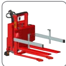
Beroende på lastens höjd, kan sidostöd med enkla eller dubbla armar väljas.