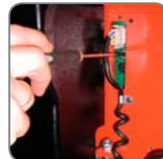
Enkel programmering av rotationsgrader och rotationshastighet.