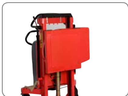
Rotator med multikonsoll på vilken kunden kan montera egna verktyg.

Sidostöd med spännanordning rekommenderas vid rotation över 60°.