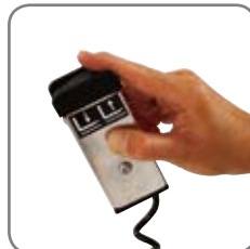
Rotatorn styrs med ett fjärrmanöverdon (med kabel som standard/trådlöst som tillbehör).