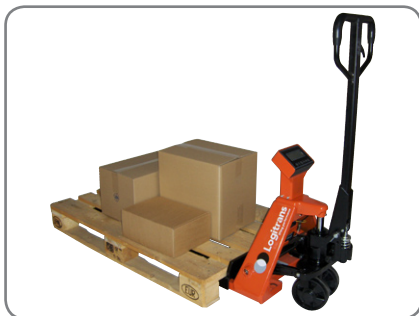
BFC6 transporterar och väger i en och samma arbetscykel.