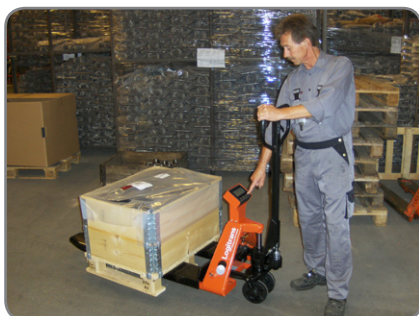
Det ideella vägsystemet - robust, noggrant och lätt att använda överallt.