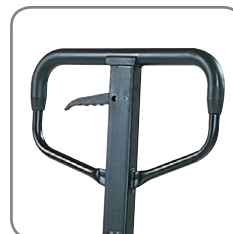
Gummibelägningen på handtaget gör det behagligt att hålla i.