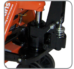
Hållbart och oljetätt hydrauliksystem.