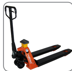
Noggrant vägningsresultat uppnås med fyra lastceller.