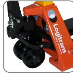
Pallvagnen har en styrvinkel på 210° och säkerställer därmed en smidig manövrering på små ytor.