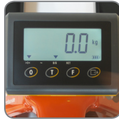
BFC6 har tara- och nollställningsfunktion.