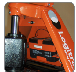
BFC6 har inbyggd laddare och en lättåtkomlig laddningskontakt.

Fråga efter mer information eller besök www.logitrans.com