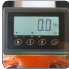
BFC6 har tara- och nollställningsfunktion.