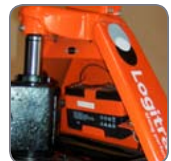
BFC6 har inbyggd laddare och en lättåtkomlig laddningskontakt.

Fråga efter mer information eller besök www.logitrans.com