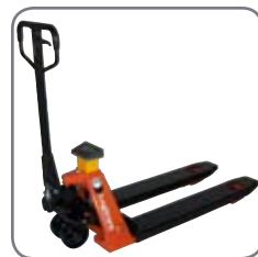
Noggrant vägningsresultat uppnås med fyra lastceller.