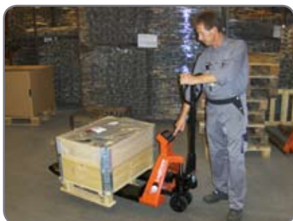
Det ideella vägsystemet - robust, noggrant och lätt att använda överallt.