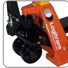
Pallvagnen har en styrvinkel på 210° och säkerställer därmed en smidig manövrering på små ytor.