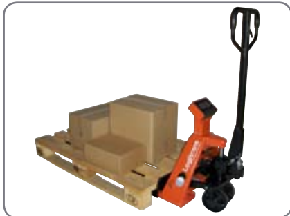
BFC6 transporterar och väger i en och samma arbetscykel.