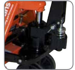
Hållbart och oljetätt hydrauliksystem.