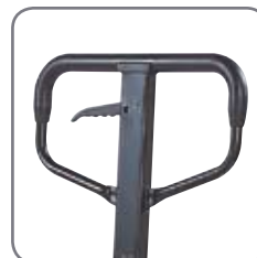
Gummibeläggningen på handtaget gör det behagligt att hålla i.