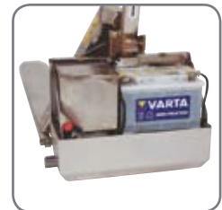
Vattenskyddad inkapsling av lyftmotorn (EHL RF-PLUS).

Fråga efter materialspecifikationer eller besök www.logitrans.com . Vi erbjuder också kundpassade lösningar.