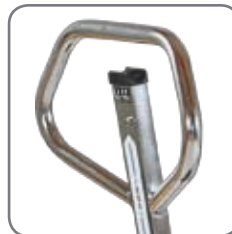
Ergonomiskt handtag ger användaren ett avslappnat grepp.