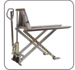
Den manuella saxlyftvagnen finns också i ett explosions-skyddad utförande.