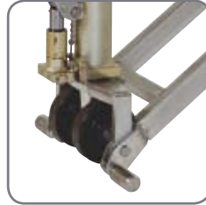
Maximal säkerhet uppnås med stöben vid styrhjulen och en central placering av alla funktioner på handtaget.