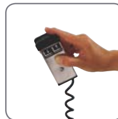
Fjärrmanövrering, även trådlös, finns som extra tillbehör (EHL).