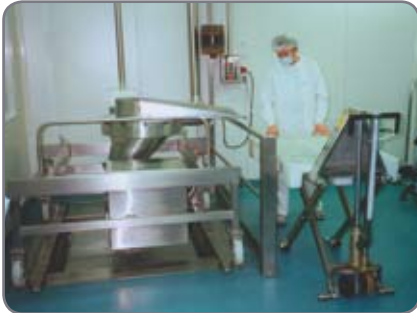
RF-PLUS för livsmedels- och läkemedelsindustrin där det ställs stora krav på hygien och rengöring.