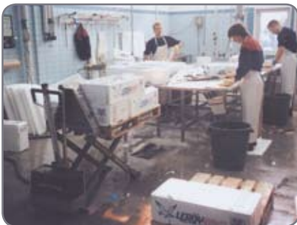
RF-SEMI för livsmedelsindustrin till de områden där hygienkraven är mindre men korrosionsskyddet viktigt.