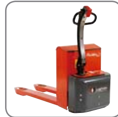
En kraftig konstruktion garanterar en lång livslängd och låga underhållskostnader.