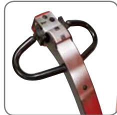
Möjligt att manövrera med styrhandtaget helt vertikalt (Multiflex-funktionen). Central placering av alla funktioner.