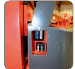
Enkel åtkomlighet till de olika delarna, gör det lätt att serva lyftvagnen.