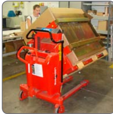
Tilt- och rotationsfunktioner är skonsamt för användaren!