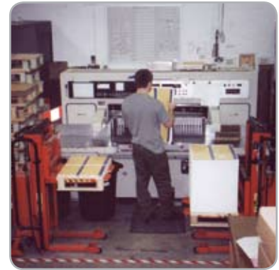
Automatisk nivåreglering ger en konstant arbetshöjd.