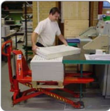
Saxlyftvagnen säkrar en ergonomiskt riktig arbetshöjd.

För transport av pappersbuntar och färdiga trycksaker på halv- och kvartspallar eller andra specialpallar, vill vi trycka på våra produkter med smalare gafflar och smalare spännvidd.