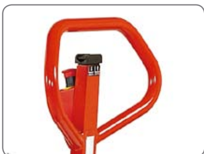
Ett ergonomiskt handtag ger användaren ett avslappnat grepp.