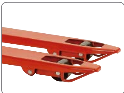
Logitrans produkter kännetecknas av en blank, hård och seg yta.