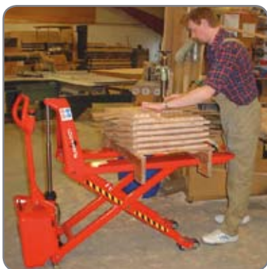
Saxlyftvagnen säkrar en ergonomiskt riktig arbetshöjd.

Samtidigt är det viktigt att användaren får de bästa möjliga arbetsbetingelserna under de säkraste förhållanden.