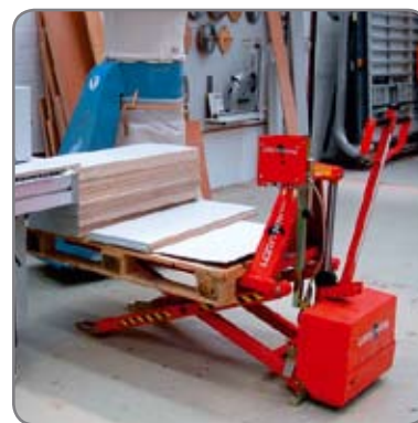
Automatisk nivåreglering ger en konstant arbetshöjd.