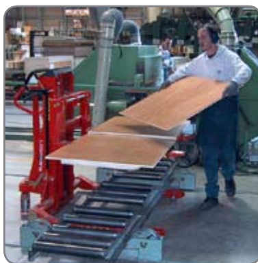
Logitrans produkter för hantering av långa, tunga och breda ämnen.