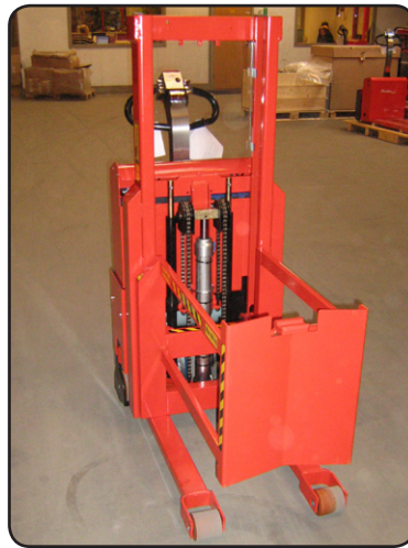
SELF Maxi med speciell fatlyftare. Fatets ena handtag används för fasthållning av fatet. P07267-2