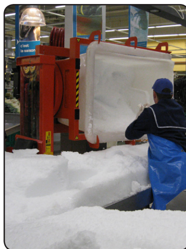
En SELF med Rotator används i en supermarket tidigt på morgnarna för att transportera och tömma upp is i fiskdiskarna. P05707-2