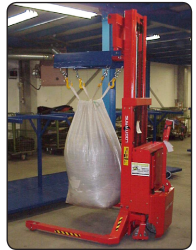
SEHSS är här en del av en line som hanterar second hand kläder. Kläderna kontrolleras för skador och läggs i vita storsäckar. 03174FC4