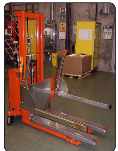
Staplare med Rotator och rostfria gaffelöverdrag. När rostfria behållare hanteras, blir de inte skadade och inga partiklar eller färg kommer i kontakt med behållarna.