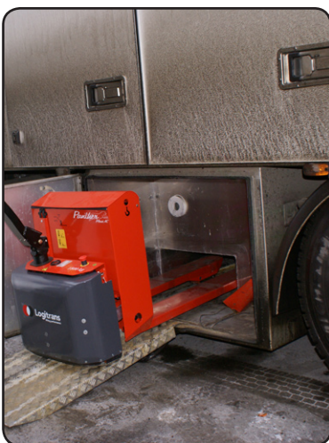
En speciell låg konstruktion gör det möjligt att placera en Panther Maxi AC i en transportbox under lastbilen vid transport. Detta ger plats för ytterligare två pallar på lastbilen. P04354