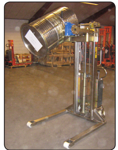
Rostfri staplare med fatvändare för lyft och tömning av fat. P06634