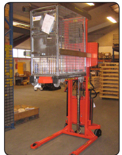
Logiflex ELF med Rotator som används av svenska Posten för tömning av brevbehållare. P06473