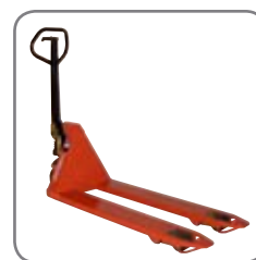
Panther Silent har permanent quicklyft.

Vi erbjuder också kundpassade lösningar. Fråga efter mer information eller besök www.logitrans.com