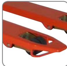
Med glidskenor vid gaffelspetsarna kan Panther Silent lätt köras in och ur lastpallar.