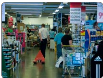
Panther Silent på en supermarket där kundens komfort och välbefinnande sätts i fokus.