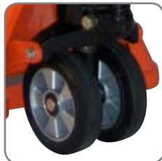
De speciella gummihjulen är skonsamma mot klinkersbelagda golv och har utmärkta antistatiska egenskaper.