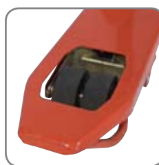
Tvillingmonterade gaffelhjul ger optimala styregenskaper.