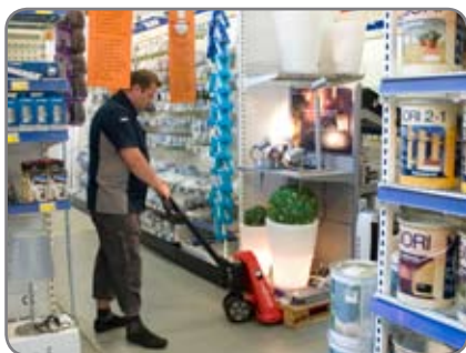
Även på mycket trånga ställen säkras en problemfri hantering av godset.