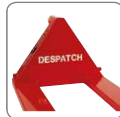
Företagets logo kan skäras ut i trekanten på Panther Silent.