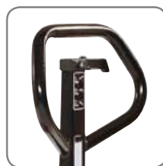
Ergonomiskt handtag ger användaren ett avslappnat grepp.