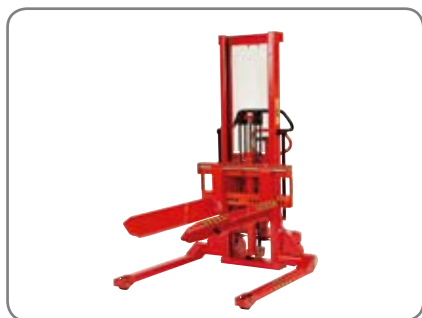
Fatgafflar - ett bra alternativ när liggande fat skall lyftas och transporteras (ej Quick-shift).

En kraftig konstruktion säkrar en lång livslängd och låga underhållskostnader.