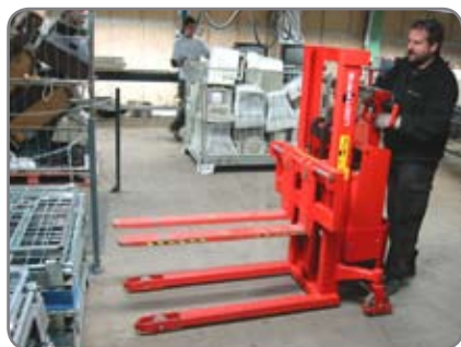
Här används de massiva gafflarna i industrin för elektronikåtervinning.