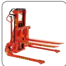
Gafflarna kan monteras på samtliga Logiflex modeller, både standard och bredspåriga.