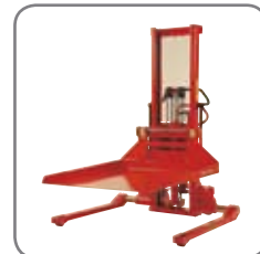
Annan extrautrustning som erbjuds är bl.a. plattform, kranarm, pikbom, fat- och rullvändare.