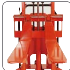
Plåtgafflar: Levereras som standard på Logiflex.