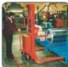
Pikbom i förpackningsindustrin.