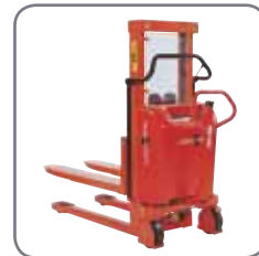
Med en icke bredspårig Logiflex, måste rullen hanteras liggande på en pall.