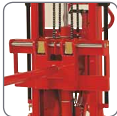
Quick-shift gör det enkelt att byta ut pikbommen mot annat tillbehör eller gafflar.

Pikbommens dimensionering är baserad på att rullens tyngdpunkt inte befinner sig längre ut än till hälften på pikbommen (konstruktionshänsyn).