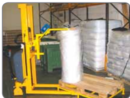
Rullvärdare. Ett bra alternativ när rullar skall lyftas och vändas.