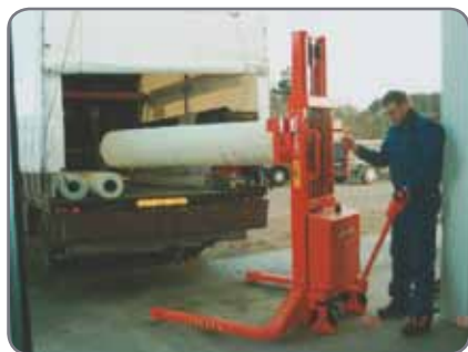
Bredspårig Logiflex vid hantering av rullar från lager till lastbil.