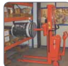
Användning av pikbom på lager.

Vi erbjuder också kundpassade lösningar. Fråga efter mer information eller besök www.logitrans.com