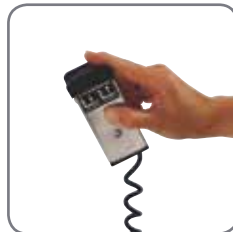
Lyft- och sänkfunktionen på de elektriska modellerna kan betjänas med ett fjärrmanöverdon (extra tillbehör).