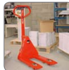
Panther kan levereras med många olika gaffellängder.

Vi erbjuder också kundpassade lösningar.