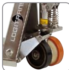
Möjlighet till olika hjulmonteringar som passar användarens behov.