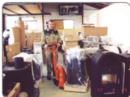
Även i mycket trånga områden får man en problemfri hantering av godset.