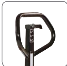
Det ergonomiska handtaget ger ett avslappnat grepp. Möjlighet till märkning med namn/avdelning.