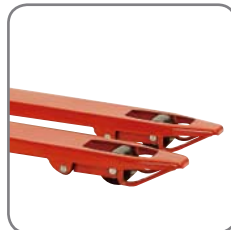
Glidskenor vid gaffelspetsarna gör att Panther lätt kan köras in och ur pallar.