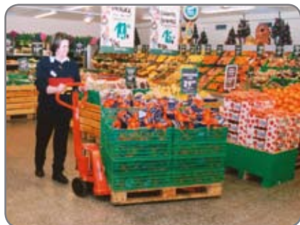
Justerbar gaffelhöjd - inga problem med låga och nerslitna pallar.

Gaffellyftvagnarna finns också i rostfria och explosionsssäkrade utföranden.