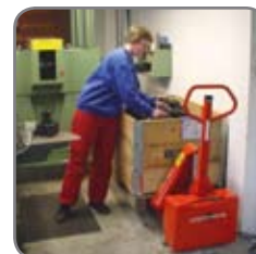
Patentansökt cylinderkonstruktion möjliggör en låg bygghöjd.

Vi erbjuder också kundanpassade lösningar. Fråga efter mer information eller besök www.logitrans.com