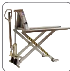
Finns också med elektriskt lyft, samt i rostfritt och ex-skyddat utförande.