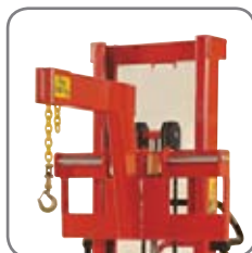
Quick-shift gör det enkelt att byta ut kranarmen mot någon annan extrautrustning eller gafflar.