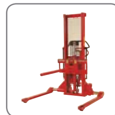
Övrig extrautrustning: Bl.a. pikbom, plattform, rull- och fatvändare