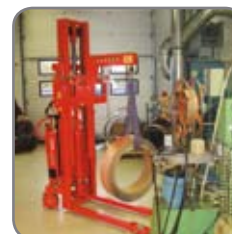
Rullar av bandstål lyfts in i en stansmaskin.

Vi erbjuder också kundanpassade lösningar. Fråga efter mer information eller besök www.logitrans.com