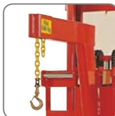
Lyftkättingens längd kan enkelt justeras utan hjälp av verktyg.