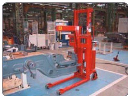
Kranarmen hos en underleverantör till tågindustrin.