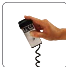
Lyft- och sänkfunktionen på de elektriska Logiflex modellerna kan betjänas med ett fjärrmanöverdon (extrautrustning).