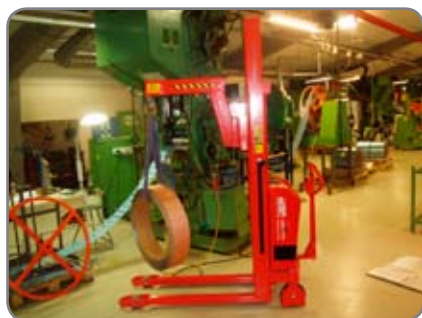
Kranarmen är konstruerad för att hantera verktyg och maskindelar.

En kraftig konstruktion säkrar en lång livslängd och låga underhållskostnader.