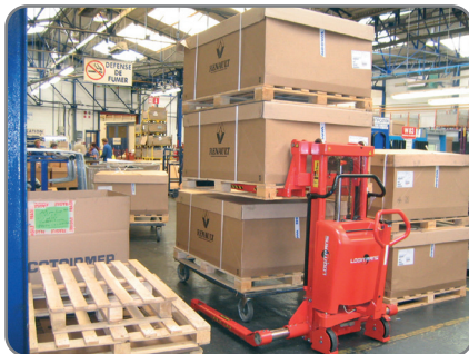
Construcción robusta que asegura una larga vida operativa y bajo coste de mantenimiento.