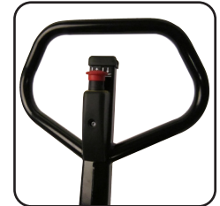
El timón ergonómico asegura al usuario un manejo cómodo. El timón se puede marcar con el nombre de la empresa/departamento.